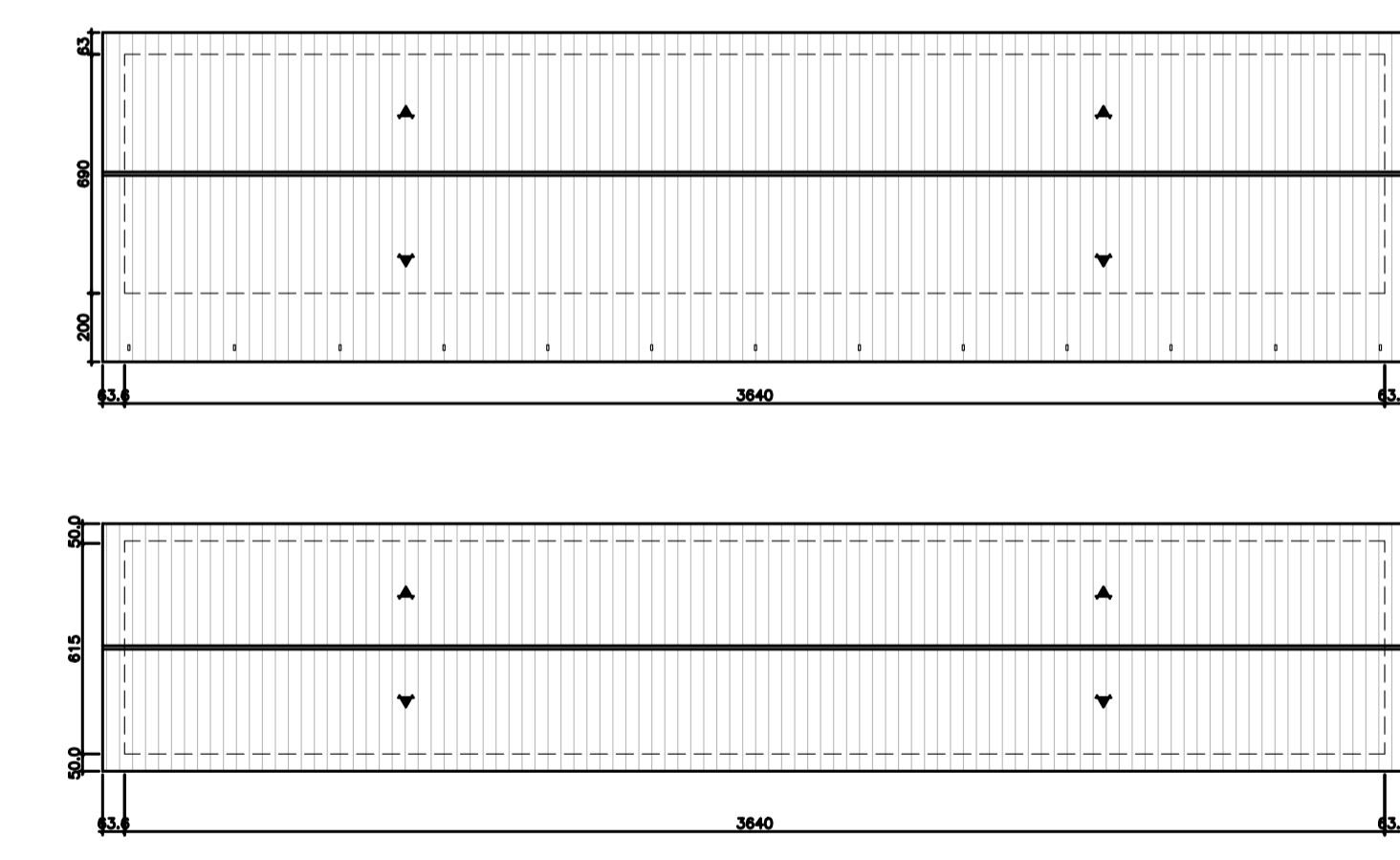
COBERTURA ESC.: 1:100