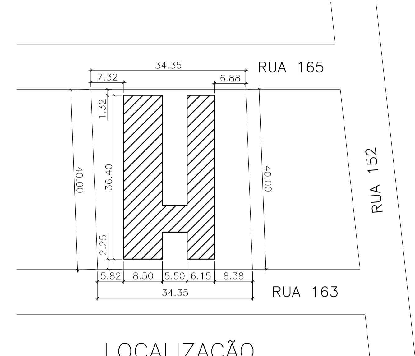
LOCALIZAÇÃO ESC.: 1:500